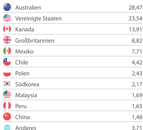
Die 10 größten Positionen in Prozent vom Gesamtportfolio