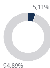
10 principales participations, en % du total

10 principales participations, en % de l'actif net total. Les participations en portefeuille sont susceptibles d'évoluer à tout moment. Les références à des titres spécifiques ne constituent pas une recommandation d'achat ou de vente et il convient de ne pas présumer ces derniers comme rentables.