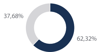
10 principales participations, en % du total

10 principales participations, en % de l'actif net total. Les participations en portefeuille sont susceptibles d'évoluer à tout moment. Les références à des titres spécifiques ne constituent pas une recommandation d'achat ou de vente et il convient de ne pas présumer ces derniers comme rentables.