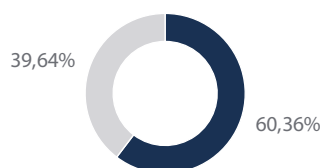
Die 10 größten Positionen in Prozent vom Gesamtportfolio

Die Top 10 Holdings werden in Prozent des Gesamtnettvermögens angegeben. Die Zusammensetzung des Fonds kann sich jederzeit ändern. Hinweise auf bestimmte Wertpapiere sollten nicht als Empfehlung zum Kauf oder Verkauf oder als Aussage über deren Gewinnpotenzial verstanden werden.