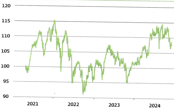
Die hier gezeigte Wertentwicklung ist keine Garantie für die zukünftige Performance. Der Wert eines Anteiles kann jederzeit steigen oder fallen. Die dargestellten Performancedaten lassen die bei der Ausgabe und Rücknahme der Anteile erhobenen Kommissionen und Kosten unberücksichtigt.