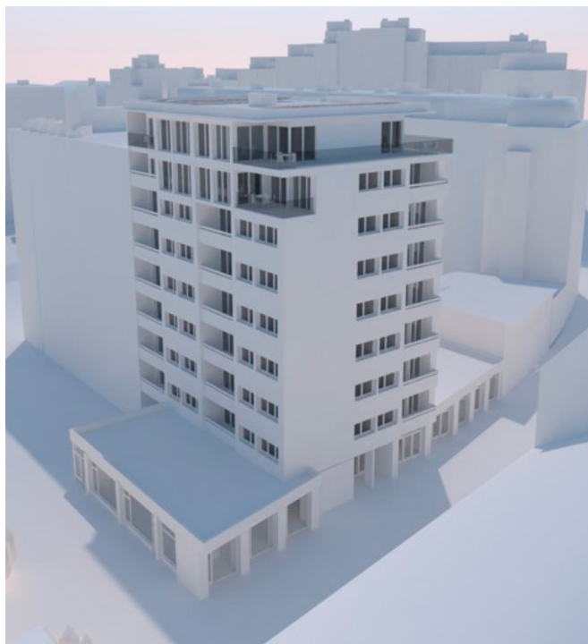
Rue de Lyon 55

Au 31.03.2024, l'immeuble affiche une valeur de marché de CHF 25.07 millions pour un prix de revient de CHF 21.59 millions et un état locatif de CHF 0.88 millions.