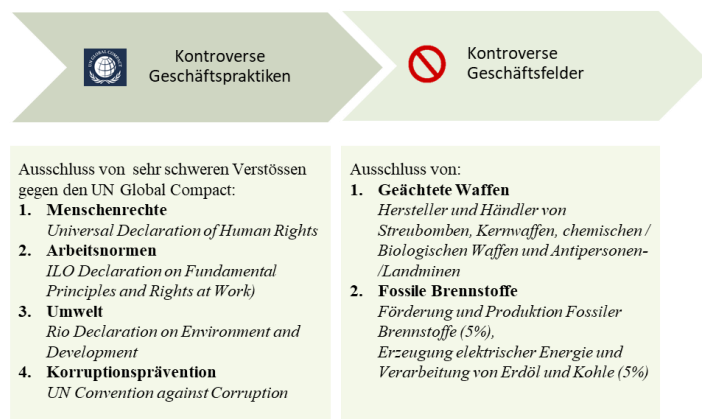
Abbildung: Generelle Ausschlüsse zur Ermittlung des BEKB Anlageuniversums

In einem weiteren Schritt werden im Rahmen einer ESG-Integration Nachhaltigkeitskriterien systematisch in den Anlageprozess eingebunden, um der konventionellen Finanzanalyse eine zusätzliche Dimension zu verleihen. Dabei werden im Rahmen einer ESG Analyse Emittenten auf deren Risiken und Chancen im Bereich Umwelt, Soziales und Governance, deren Management von Klimarisiken sowie deren Verwicklung in kontroverse Geschäftspraktiken analysiert. Als Basis dienen die beiden Kennzahlen "ESG Performance Score" und ein "Carbon Risk Rating", welche durch ISS ESG ( www.issgovernance.com/esg-de ) auf Emittentenebene ermittelt werden.