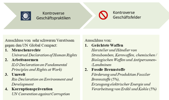
Abbildung: Generelle Ausschlüsse zur Ermittlung des BEKB Anlageuniversums

die gemäss der Vermögensverwalterin BEKB die Geschäftsfelder geächtete Waffen und fossile Brennstoffe fallen, vgl. nachfolgende Abbildung.