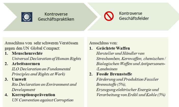
Abbildung: Generelle Ausschlüsse zur Ermittlung des BEKB Anlageuniversums

In einem weiteren Schritt werden im Rahmen einer ESG-Integration Nachhaltigkeitskriterien systematisch in den Anlageprozess eingebunden, um der konventionellen Finanzanalyse eine zusätzliche Dimension zu verleihen. Dabei werden im Rahmen einer ESG-Analyse Emittenten auf deren Risiken und Chancen im Bereich Umwelt, Soziales und Governance, deren Management von Klimarisiken sowie deren Verwicklung in kontroverse Geschäftspraktiken analysiert. Als Basis dienen die beiden Kennzahlen "ESG Performance Score" und ein "Carbon Risk Rating", welche durch ISS ESG ( www.issgovernance.com/esg-de ) auf Emittentenebene ermittelt werden.