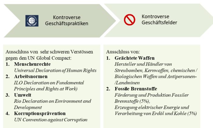
Abbildung: Generelle Ausschlüsse zur Ermittlung des BEKB Anlageuniversums

In einem weiteren Schritt werden im Rahmen einer ESG-Integration Nachhaltigkeitskriterien systematisch in den Anlageprozess eingebunden, um der konventionellen Finanzanalyse eine zusätzliche Dimension zu verleihen. Dabei werden im Rahmen einer ESG-Analyse Emittenten auf deren Risiken und Chancen im Bereich Umwelt, Soziales und Governance, deren Management von Klimarisiken sowie deren Verwicklung in kontroverse Geschäftspraktiken analysiert. Als Basis dienen die beiden Kennzahlen "ESG Performance Score" und ein "Carbon Risk Rating", welche durch ISS ESG ( www.issgovernance.com/esg-de ) auf Emittentenebene ermittelt werden.