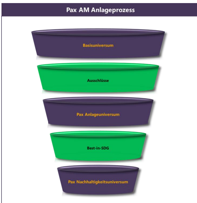
Abbildung 1: Pax Asset Management Nachhaltigkeitsprozess

Die Vermögensverwalterin verwendet somit ein mehrstufiges Verfahren zur Ermittlung des Pax Nachhaltigkeitsuniversums.